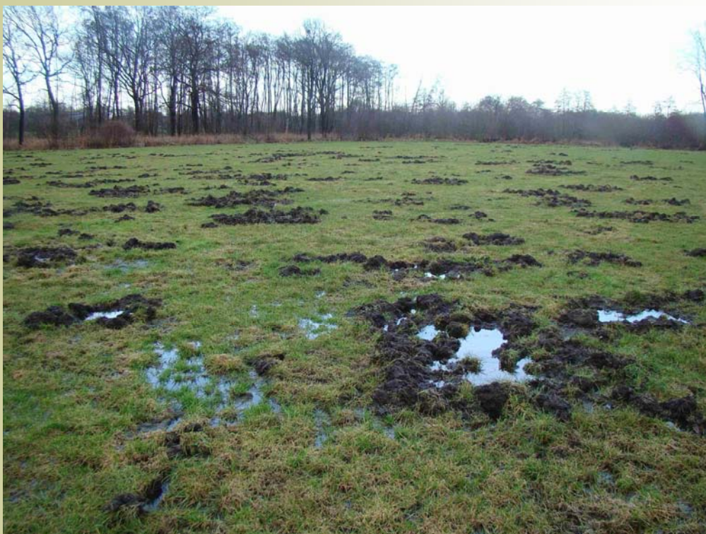
Weiland aan de Heggerdijk na een bezoek van wilde zwijnen