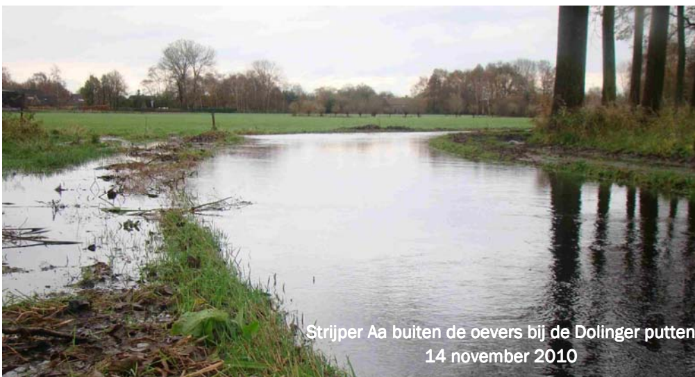
Strijper Aa buiten de oevers bij de Dolinger putten 14 november 2010